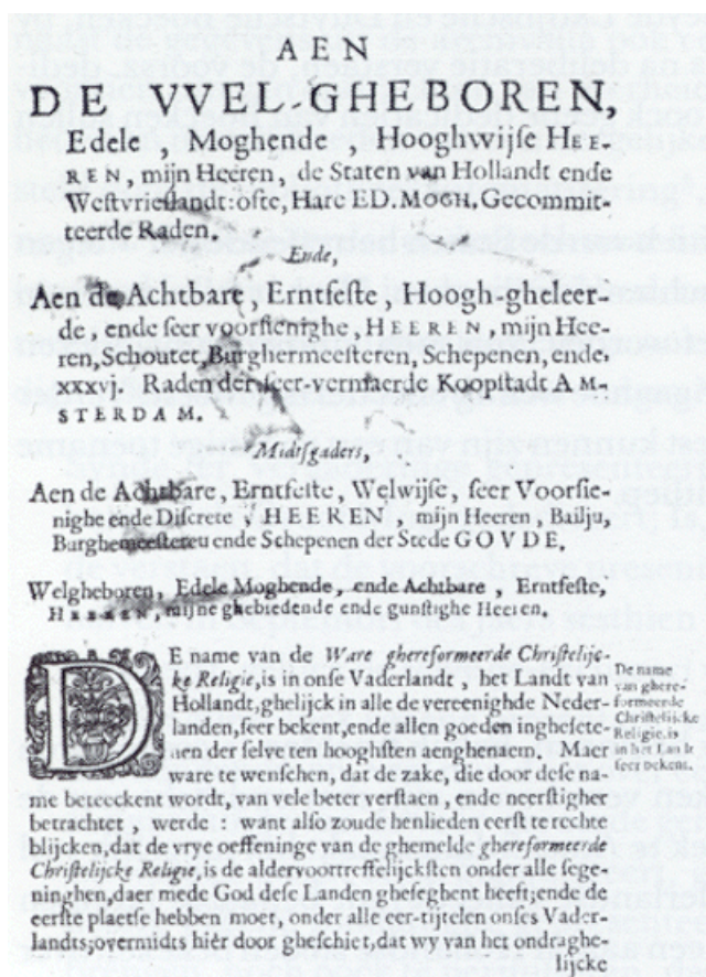
Afb. 2. Het begin van de opdracht aan de Staten van Holland en West-Friesland en aan de magistrat van Amsterdam en Gouda in Eduardius Poppius De enge poorte (UB-Amsterdam 417 F2, fol. A2r).

De acht dedicaties aan de Staten van Holland betreffen de volgende boeken: