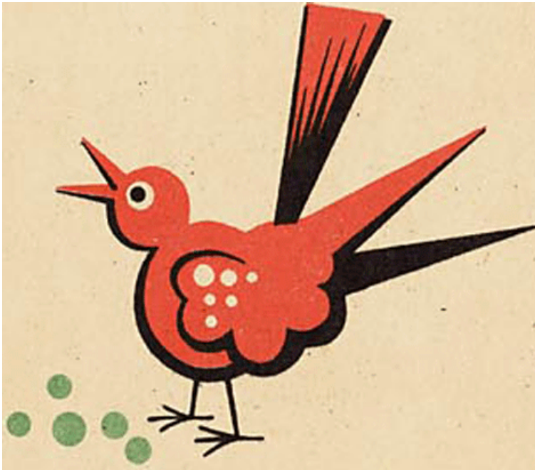
DRUKKERIJ J. VAN BOEKHOVEN, UTRECHT