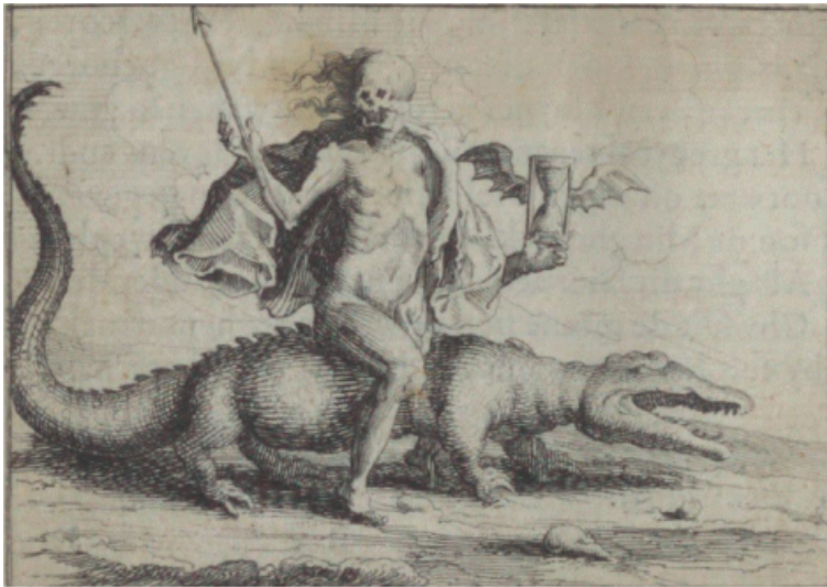
Hy wast ghestadigh aen.