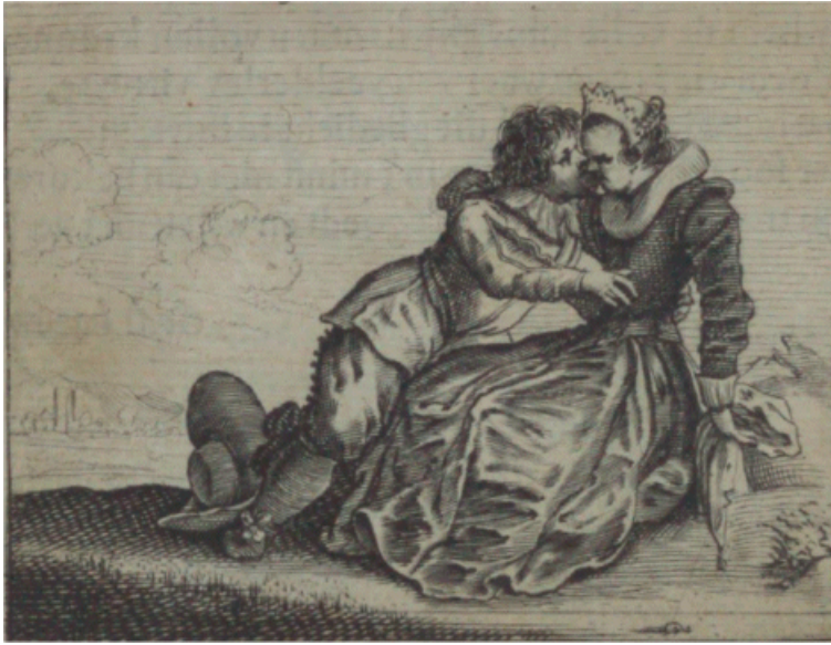
De Liefd' en siet geen leet.