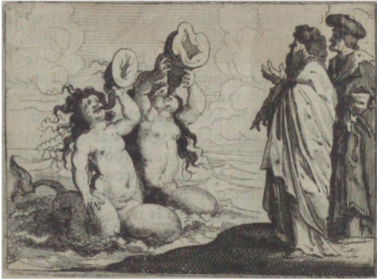
Vermomde schijn bedriegt.