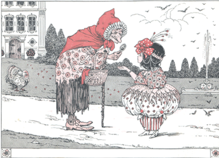
ZEG KIJK EENS, ZEI DE KOOPVROUW TOEN