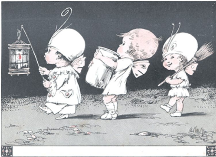
DIK, DOP EN DUIMPJE