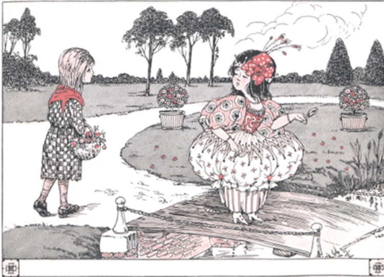
BA! ZEI MIROLIJNTJE