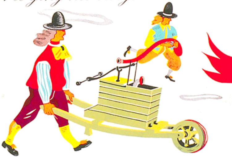
Lo ging het vroeger