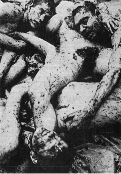
. . . Moord als geloof, Jonestown, november 1978 . . .