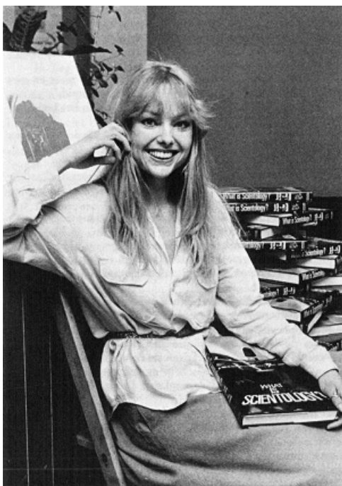
... Dom gansje ...