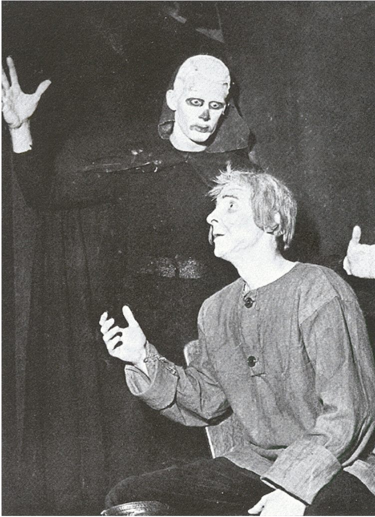
De Doot komt Goet Ront halen in Het esbatement van den appelboom tijdens een studentenvoorstelling in Leiden, 1963.