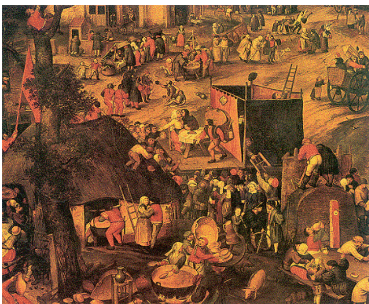
Detail van de Boerenkermis van Pieter Balten, waar de klucht Playerwater wordt opgevoerd.

deze een stuk eenvoudiger - waar de onderlinge verhoudingen tussen de elkaar bestrijdende partijen zich niet of nauwelijks wijzigen.