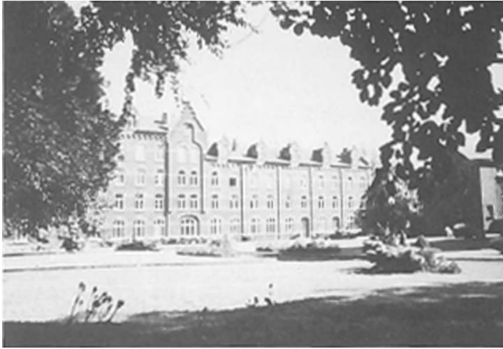
Nieuwe gebouwen op de plaats van het vroegere Bogaardenklooster. Al in 1592 genoemd 'Tcloester van mariendael de Bogaerden'.