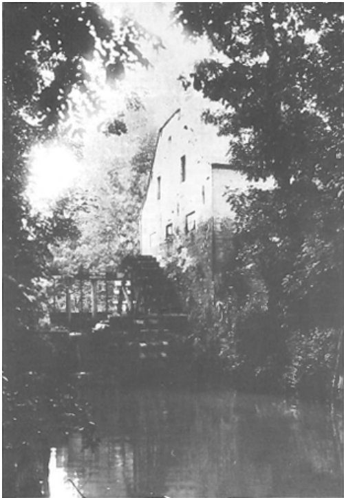
Kleine Molen op de Gete tussen Klein Overlaar en Rommersom. Gebouwd 2e helft 14e eeuw. Eigendom van de Bogaarden sedert 1476. Als nationaal goed verkocht in 1798.