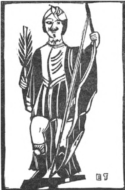
MOET HIJ EEN FELLE VENT GEWEEST ZIJN