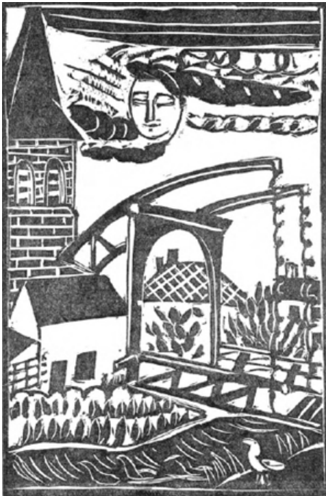
LANGS DEN RAND VAN DEN MARKENTOREN